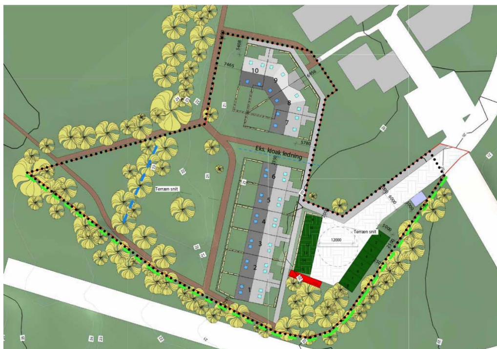
Illustrationsplan fra lokalplanen

Parkeringsområdet er placeret samme sted som parkeringsområdet til den tidligere daginstitution i området.